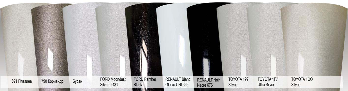
691 Платина 790 Кориандр Буран FORD Moondust Silver 2431 FORD Panther Black RENAULT Blanc Glacier UNI 369 RENAULT Noir Nacre 676 TOYOTA 199 Silver TOYOTA 1F7 Ultra Silver TOYOTA 1C0 Silver

Изображение цветовых вариантов носит ознакомительный характер и не может передать на 100% всю красоту и богатство коллекции.